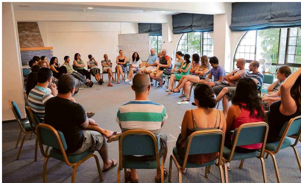
Palestijnse en Israëlische jongeren in een kringgesprek tijdens het seminar op Cyprus.

„En zowel de Palestijnse politiek als de rechterflank in Israël brengen organisaties die ontmoetingen organiseren in diskrediet. Vooral onder Palestijnen is het lastig om deelnemers voor het seminar te werven, want in de Palestijnse samenleving is het taboe om banden aan te knopen