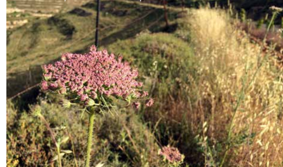
Bronnen van hoop in het dorre landschap

'Jong in Israël: tussen hoop en frustratie' (Volkskrant, 14-05-2018). Recent zag ik de indrukwekkende film Foxtrot van de Israëlische regisseur Samuel Maoz waarin ouders het noodlot treft van het verlies van hun zoon in het leger. Veel jonge Israëli's maken complexe en vaak ook traumatiserende ervaringen mee in