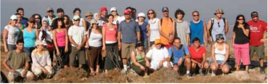
De deelnemers van het ontmoetingsseminar 2008.

Veertig jonge mensen hebben elkaar ontmoet op een intensieve manier, soms spannend, soms vrolijk, soms zeer ontspannen, maar ook emotioneel aangrijpend. In een hotel in Droushia op het eiland Cyprus gingen ze de confrontatie aan. De verhalen waren zonder tal. De verhalen van de jongen uit de nederzetting op de Westbank bijvoorbeeld: Hij praatte voor het eerst in zijn leven rechtstreeks met Palestijnen uit Bethlehem (die op een ‘steenworp’ afstand van zijn woonplaats wonen). De verhalen van de Palestijnse jongen wiens familiehuus door bulldozers van het Israëliëse leger vernietigd was. De reactie van een Israëliër “Waarom praat je nog met ons, hoe is dat mogelijk?”. De verhalen van het Islamitische meisje, die zich afvroeg of de inspanning om Israëliërs te ontmoeten wel de moeite waard was. Ze was bang dat het ten koste gingen van haar gemoedsrust. Daarnaast het verhaal van een Joods meisje dat juist door deze ontmoeting nu eindelijk Arabisch ging leren. Verhalen die soms dramatisch zijn, soms gewoon. Vanwege de situatie worden die verhalen telkens met een intensiteit boven het gewone uitgetild.