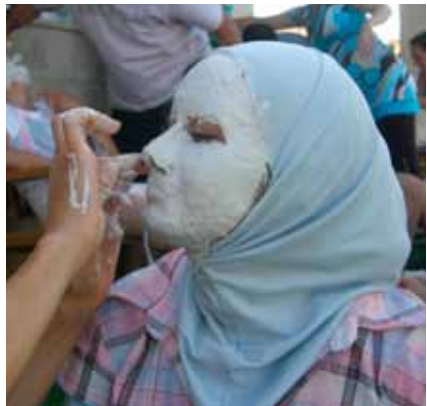
Maskers maken tijdens het seminar op Cyprus

Zo ook weer het ontmoetingsseminar dat afgelopen zomer op Cyprus werd georganiseerd. Veertig jonge mensen uit Israël en Palestina kwamen op uitnodiging van CoME naar Cyprus. Zoals dat nu al jaren gebeurt vanuit een situatie, die wat politiek en geweld betreft als uitzichtloos bestempeld kan worden. De deelnemers kwamen naar Cyprus uit nieuwsgierigheid naar de ‘ander’, vanuit een oprecht verlangen de ander te ontmoeten. Om nu eens die ander te kunnen zeggen wat je altijd wilde zeggen, ook om zelf op een andere manier in het conflict te staan.