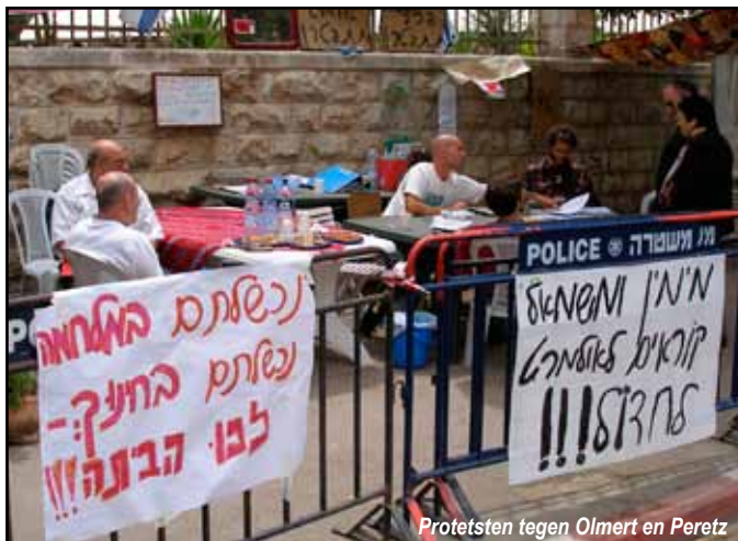
Protesten tegen Olmert en Peretz

dat er ooit een einde aan komt (We hebben nog minstens honderd jaar oorlog, zeggen velen) roept men op: nieuwe acties, harder toeslaan, vernietig de terreur!